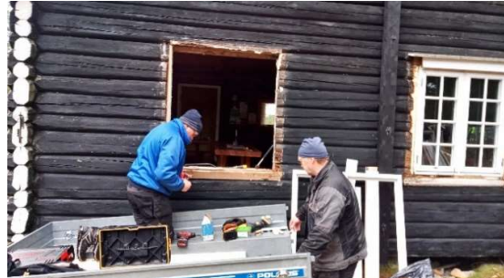
Vinduer ut og inn