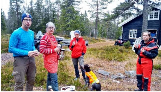
Matpause i dugnaden