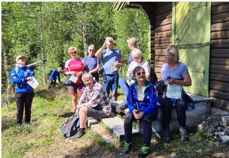
Bilde: Samling ved Damholkoia